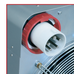
Spatwaterdichte connector 380/415V, 63A, 3P+N+A IEC EN-60529