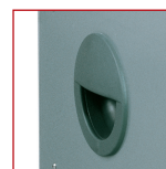
Ergonomisch handvat voor het vervoer