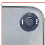
Schakelaar voor de thermostatische ventilatie/doorlopende ventilatie