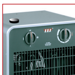
Schakelaar voor het starten, ventilatie en temperatuur