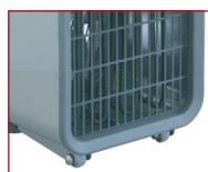
Wieltjes voor het verplaatsen