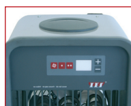
Schakelaar voor het starten, ventilatie en temperatuur

2 De driefazige modellen AER-PE5 tot AER-PE12 worden ook geleverd in 3x230V (raadpleeg ons).