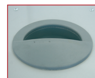
Ergonomisch handvat voor het vervoer