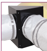
02AC546 / 02AC505