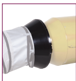
02AC501 / 02AC502 / 02AC503