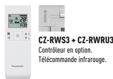
CZ-RWS3 + CZ-RWRU3 Contrôle en option. Télécommande infrarouge.