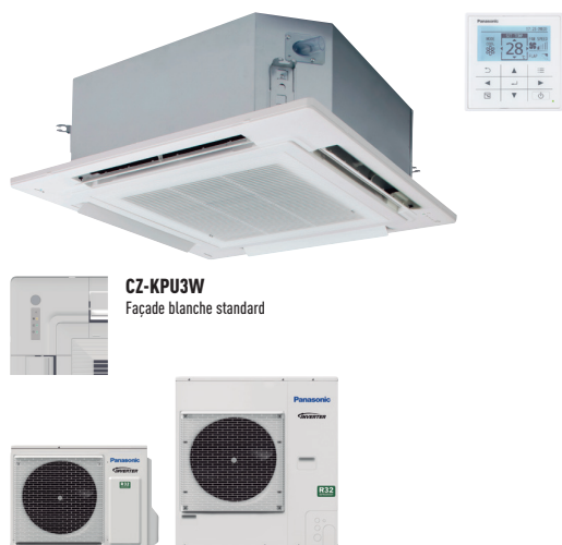
CZ-KPU3W Façade blanche standard