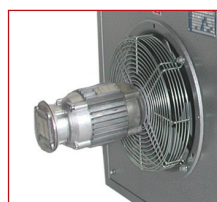
Moteur avec protection