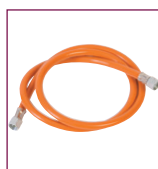
Tuyau de gaz