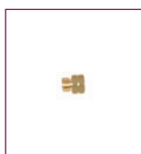
Réducteur de pression