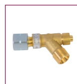
Vanne stop gaz