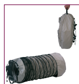
02AC562 / 02AC565 / 02AC566 / 02AC567 / 02AC568