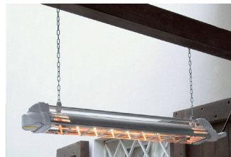
Installation au plafond

1 RI-EXT 3x1200: modèle complet, avec mat et trépied