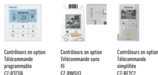
Contrôleurs en option Télécommande programmable CZ-RTCSB

Opère une circulation d'air dans toute la pièce lorsque celle-ci est vide. Minimise les écarts de température en mode chauffage et rafraîchissement.